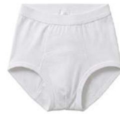
ショーツ 婦人用 S・M・L・LL

日用品各種 ※以下すべてのアイテムが利用可能です。状況に合わせてご使用ください。