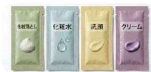
化粧落とし・洗顔料 化粧水・保湿クリーム