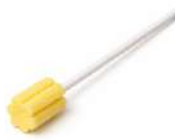
口腔ケア スポンジ