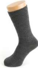
紳士用 1サイズ サイズ：24～28 cm