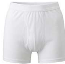
サルマタ 紳士用 S・M・L・LL