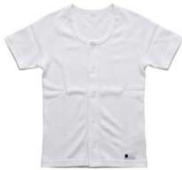
前開き半袖シャツ 男女共用 S・M・L・LL