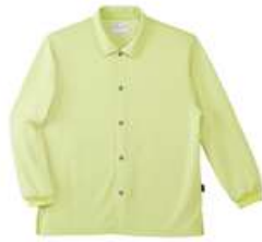
前開きシャツ 男女共用 S・M・L・LL